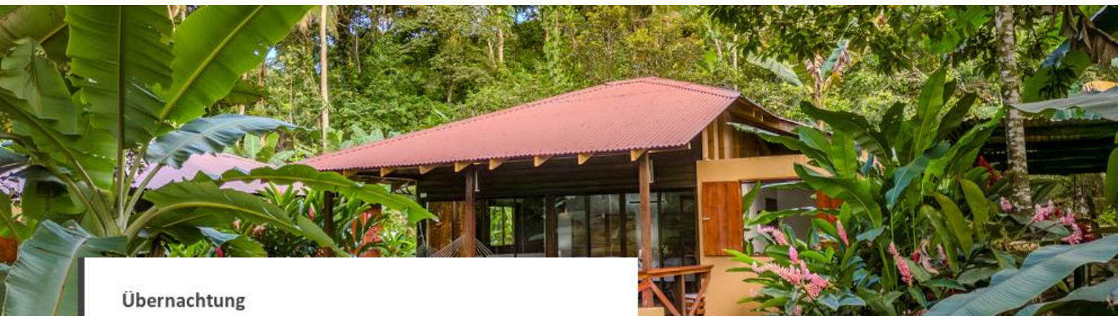
Übernachtung Boca Tapada Lodge